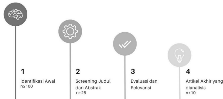
Gambar 2. Alur Pengambilan Sampel Artikel

Artikel yang lolos tahap ini kemudian dianalisis secara mendalam dengan mengekstraksi data penting seperti tujuan penelitian, metode yang digunakan, temuan utama, dan kontribusi terhadap pengembangan konsep inklusivitas dalam perumahan. Analisis dilakukan dengan pendekatan tematik, di mana artikel dikategorikan ke dalam tema-tema besar seperti strategi desain arsitektur inklusif, inovasi teknologi konstruksi yang hemat biaya, dan sistem mekanikal efisien untuk perumahan padat. Hasil pengelompokan ini kemudian disintesis untuk memberikan gambaran utuh dan mendalam mengenai integrasi strategi lintas disiplin dalam menciptakan rumah subsidi bertumbuh yang inklusif. Proses seleksi dan inklusi artikel divisualisasikan melalui diagram (Gambar 2), yang memperlihatkan alur dari identifikasi hingga artikel akhir yang dianalisis.