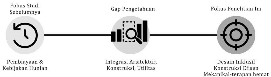
Gambar 1. Gap Analisis

Pertumbuhan kawasan perkotaan di Indonesia yang semakin padat telah mendorong meningkatnya kebutuhan terhadap penyediaan hunian yang layak dan terjangkau, khususnya bagi kelompok masyarakat berpenghasilan rendah. Program rumah subsidi menjadi salah satu upaya strategis pemerintah dalam menjawab tantangan ini. Namun, dalam pelaksanaannya, berbagai permasalahan masih dihadapi, seperti keterbatasan lahan, rendahnya kualitas bangunan, keterbatasan akses terhadap fasilitas dasar, serta kurangnya fleksibilitas ruang untuk berkembang. Di sisi lain, upaya pembangunan perumahan bersubsidi juga perlu mempertimbangkan prinsip inklusivitas, tidak hanya dalam aspek sosial seperti keterjangkauan oleh berbagai kelompok masyarakat, tetapi juga dalam aspek teknis yang melibatkan desain arsitektural, efisiensi konstruksi, dan sistem utilitas bangunan.